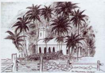
Kostel sv. Filomény, autorem grafiky je malomocný Ed Kato