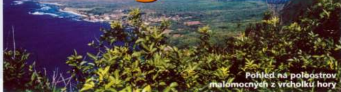
Pohled na poloostrov malomocných z vrcholku hory