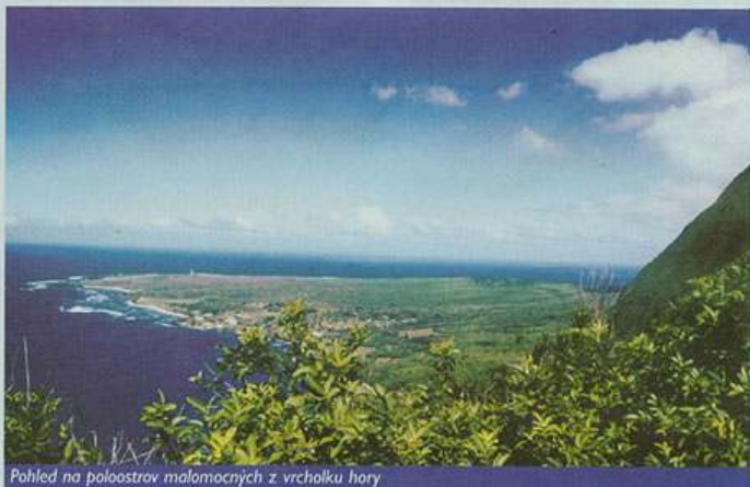
Pohled na poloostrov malomocných z vrcholku hory

NA GYMNÁZIU V ŽILINĚ, ODKUD POCHÁZÍM, JSEM ČETL ŽIVOTOPIS BELGICKÉHO KNĚZE DAMIANA DE VEUSTER – „OTEC VYHOSTĚNÝCH“. SKUTEČNÝ PŘÍBĚH KATOLICKÉHO KNĚZE A MISIONÁŘE, KTERÝ PŮSOBIL V 19. STOLETÍ V LEPROSÁRIU NA OSTROVĚ MOLOKA'I. KNIHA MNE VELICE OSLOVILA A ZŘEJMĚ SEHRÁLA V MÉM ŽIVOTĚ DŮLEŽITOU ROLI, PROTOŽE JSEM POZDĚJI VYSTUDOVAL TEOLOGII. A JIŽ TEHDY JSEM ZATOUŽIL PO TOM, ABYCH JEDNOU TENTO OSTROV NAVŠTÍVIL.