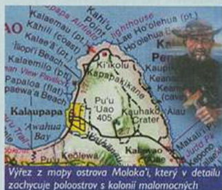
Výřez z mapy ostrova Moloka'i, který v detailu zachycuje poloostrov s kolonií malomocných

text: Peter Žaloudek