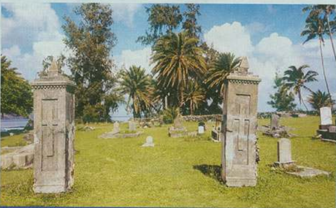
Zde jsou pochováni ti, které osud přivedl na ostrov malomocných

10. května 1873 připlouvá malou lodí na ostrov. O této události se zachovaly zprá-