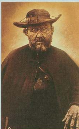
Pater Damian krátce před smrtí